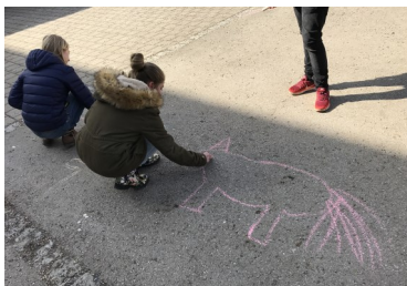
Freizeit nach dem Essen