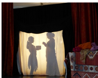
Aktivierungs- und Entspannungsphasen